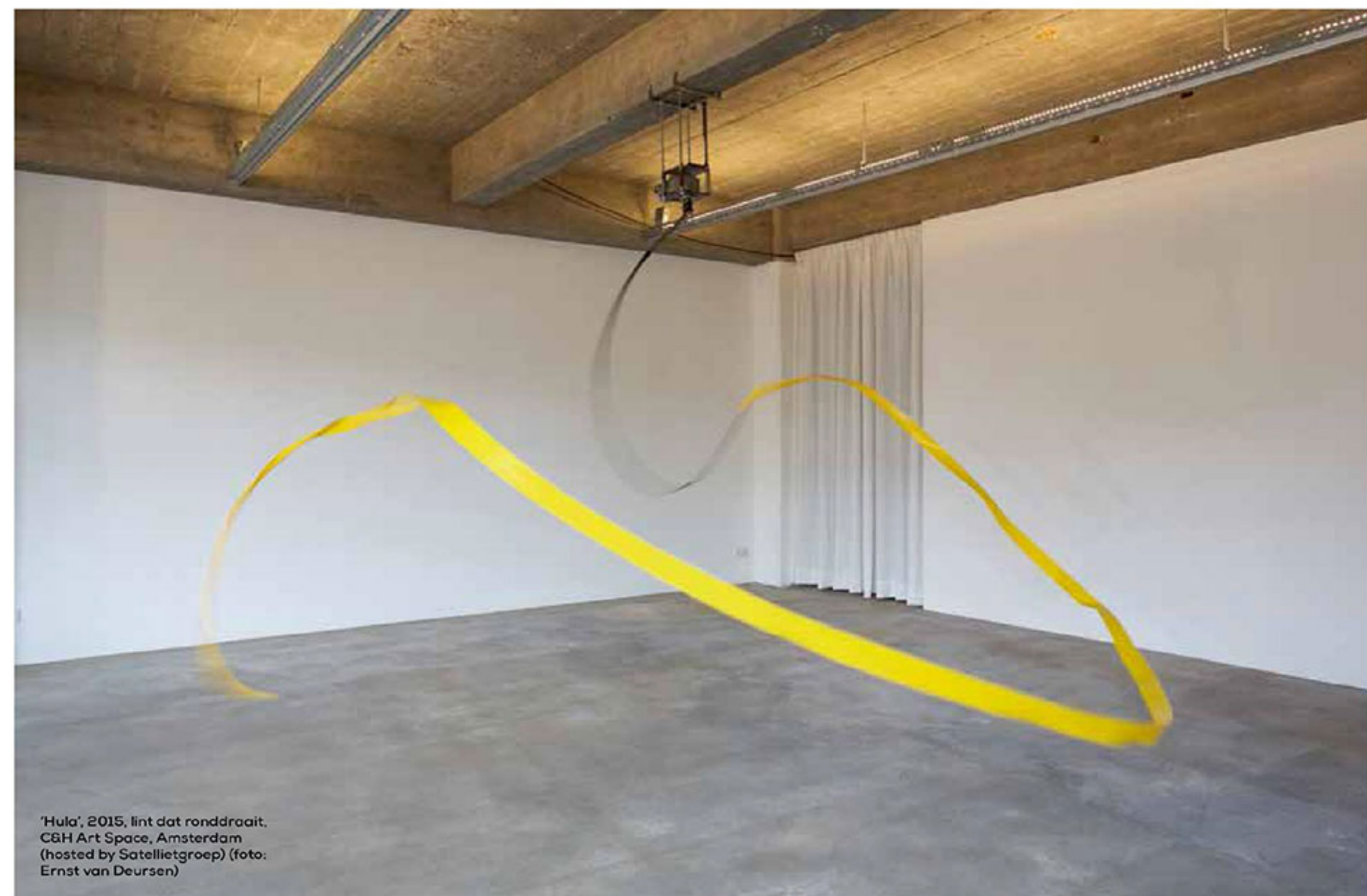
'Hula', 2015, lint dat ronddraait. C&H Art Space, Amsterdam (hosted by Satellietgroep)

Met zijn zwiepende en bewegende kunstwerken timmert Zoro Feigl flink aan de weg. Op verzoek werkte hij samen met de glasblazers van Murano. Het resultaat: bollen die van binnen druipen. DOOR SABETH SNIJDERS