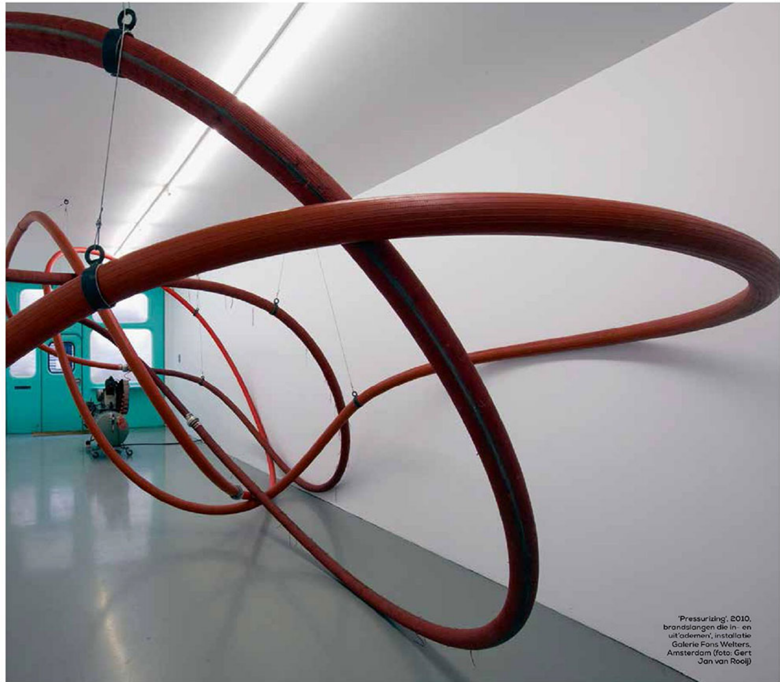
'Pressurizing', 2010, brandslangen die in- en uit'ademen', installatie Galerie Fons Welters, Amsterdam

Zijn atelier doet denken aan de opslagplaats van een schroothandelaar, vol planken, rubberbanden en oud ijzer.