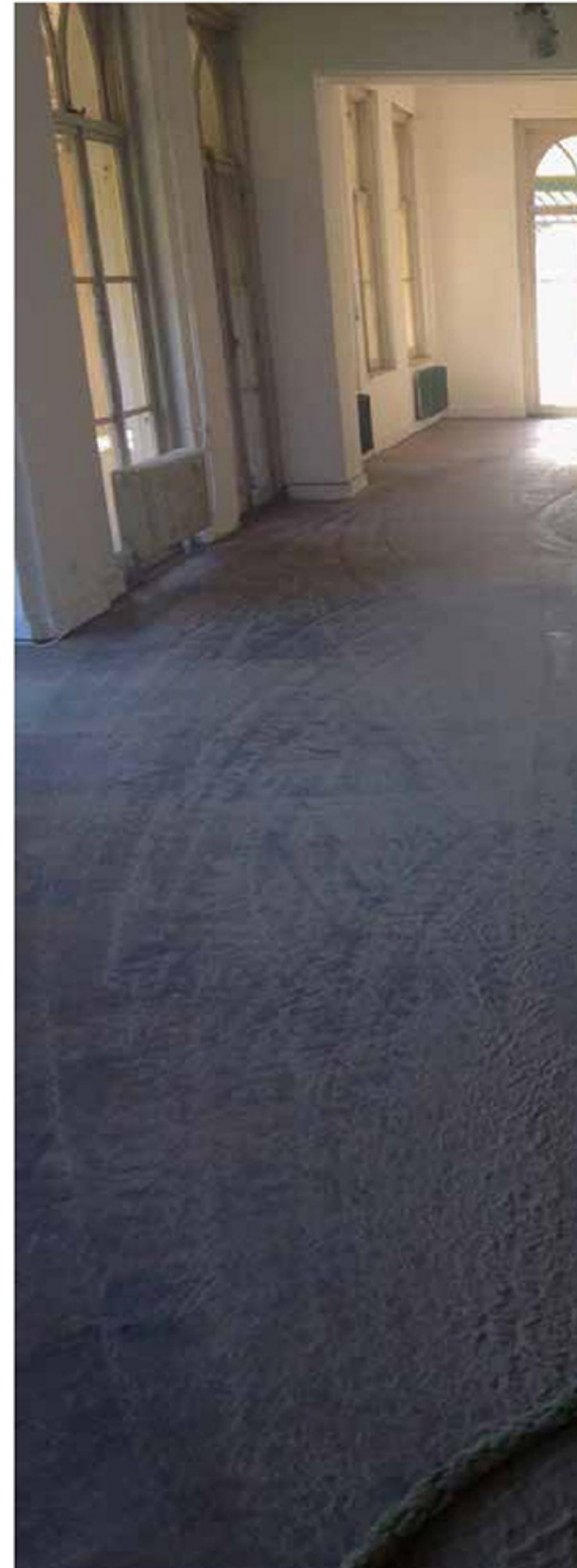
'Untangling the tides', 2014, touw dat beweegt als de branding, installatie Villa Ockenburg, Den Haag (hosted by Satellietgroep)