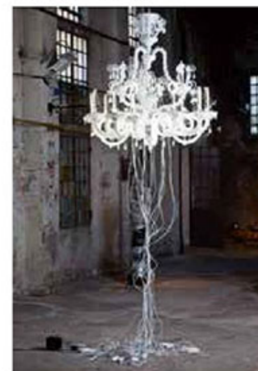
Yuichi Higashionna, ‘Seta/Chandelier’, 2011, kroonluchter van Muranoglas, neon, 150 x ø 140 cm

Winactie! Museumtijdschrift verloot 75 X 2 kaarten voor een speciale lezing over GlassFever. Zie voor deelname p. 5.